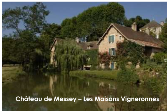
Château de Messey – Les Maisons Vignerones